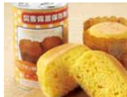
パンプキン 1 缶