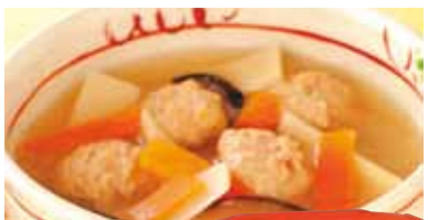
つくねと野菜 のスープ