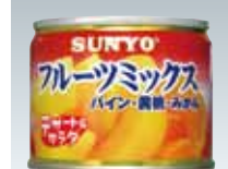
フルーツミックス