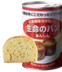
黒豆 1 缶