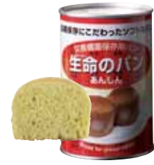
プチヴェール 1 缶