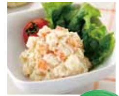
ポテトツナサラダ 0215463

●エネルギー：125kcal (1食 当たり) ●梱包サイズ：320× 240×90mm (W×D×H)