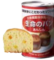
オレンジ 1 缶