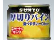
厚切りパイナップル