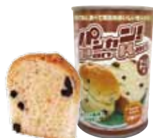
チョコチップ 1 缶