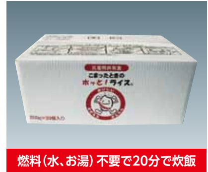
燃料(水、お湯)不要で20分で炊飯