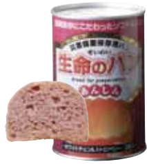
ホワイトチョコ&ストロベリー1缶