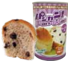
レーズン 1 缶