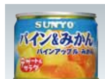
パイナップルとみかん