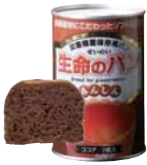
ココア 1 缶

1缶にマフィンタイプのパン2個入り。おいしさにこだわったふっくら・やわらかい5種類のパン。缶切りを使わず、誰でも簡単に開けられるイージーオープン缶。防腐剤・脱酸素剤は使用せず、真空高温殺菌です。