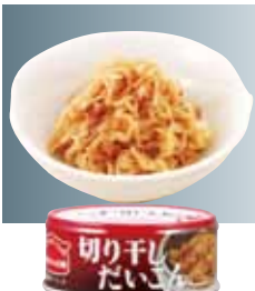
切り干しだいこん