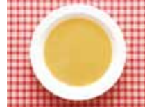
コーンポタージュ