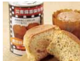
黒豆 1 缶