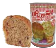
コーヒーナッツ 1 缶