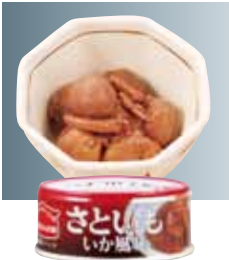
さといもいか風味