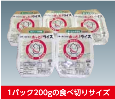
1パック200gの食べ切りサイズ