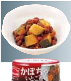
かぼちゃいとこ煮