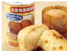
キャラメルチョコ 1 缶