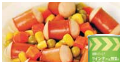
ウインナーと野菜の スープ煮

●エネルギー：68kcal (1食当たり) ●梱包サイズ：380×220×110mm (W×D×H)